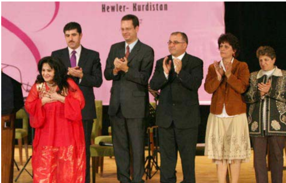
Preisverleihung durch den Ministerpräsidenten der Kurdischen Regionalregierung am 25.11.2007

wichtige Empfehlungen für Regierung und Zivilgesellschaft für den Umgang mit der Prostitution. Der Preis wurde vom Ministerpräsidenten der Kurdischen Regionalregierung Nechirwan Barzani verliehen.